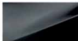
Phantom Black (PAE)