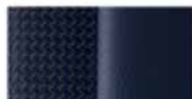
Μπλε Υφασμα/ Δέρμα