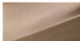
Satin Amber (PSP)