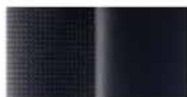
Μαυρο Υφασμα / Δέρμα