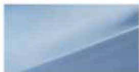
Ice Blue (XAF)