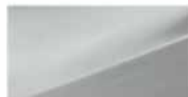
Sleek Silver (RAH)