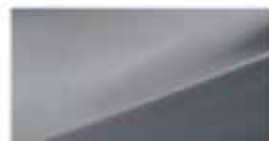
Steel Gray (ZAR)