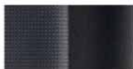
Μαυρο Υφασμα Premium (GLS)