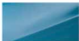
Aqua Blue (TZU)