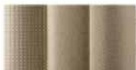
Μπεζ Υφασμα (GL)