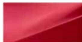
Cool Red (ITWR)