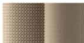
Μπεζ Υφασμα Premium (GLS)