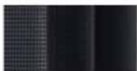
Μαυρο Υφασμα (GL)