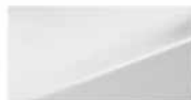
Creamy White (TCW)